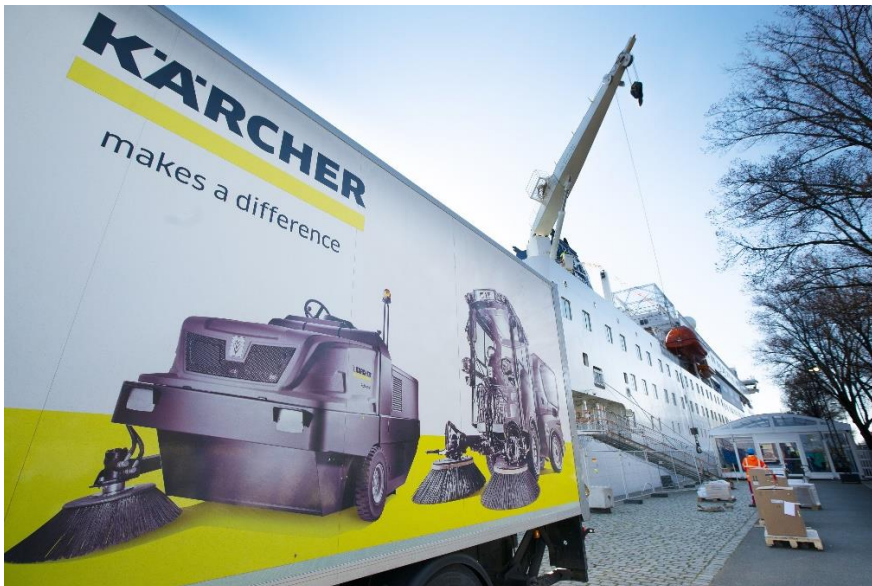
Kärcher schonk professionele reinigingstoestellen en eco!efficiency reinigingsmiddelen om het schip de komende jaren onberispelijk te houden.

“De ‘operations’ worden mogelijk gemaakt door privé giften van personen, stichtingen en bedrijven - we ontvangen geen geld van de overheid. Daarnaast betalen onze vrijwilligers ook een bijdrage voor kost en inwoning. De bouw van het schip is eveneens gefinancierd door giften van particulieren en bedrijven.”